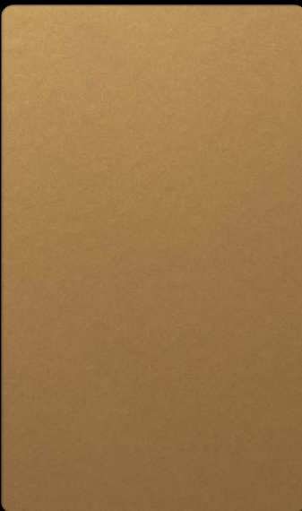
Anodic Gold AE20111000820