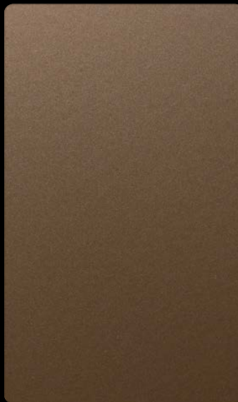
Anodic Bronze AE20108000320