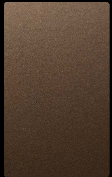
Anodic Brown AE20108000420